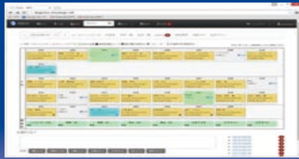
宿守インターフェイス画面 (例)